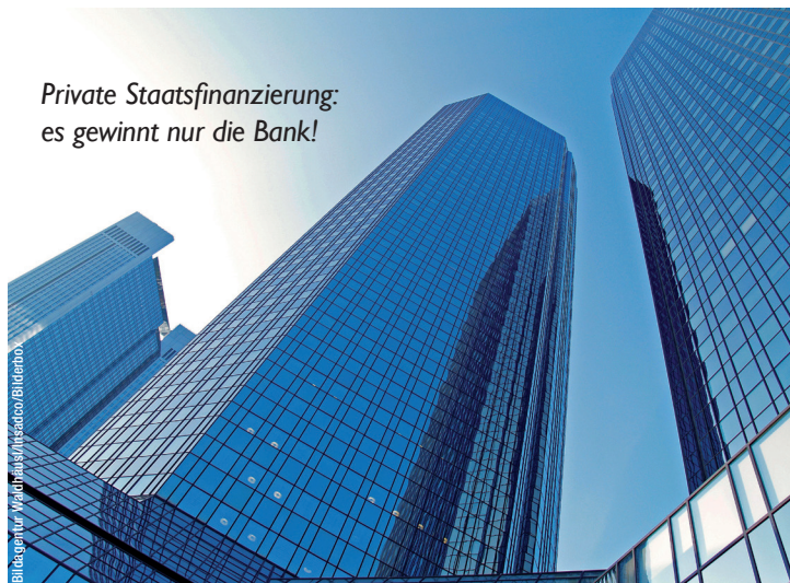
Bildagentur Waldhaus / Waldhaus Franz

Private Staatsfinanzierung: es gewinnt nur die Bank!