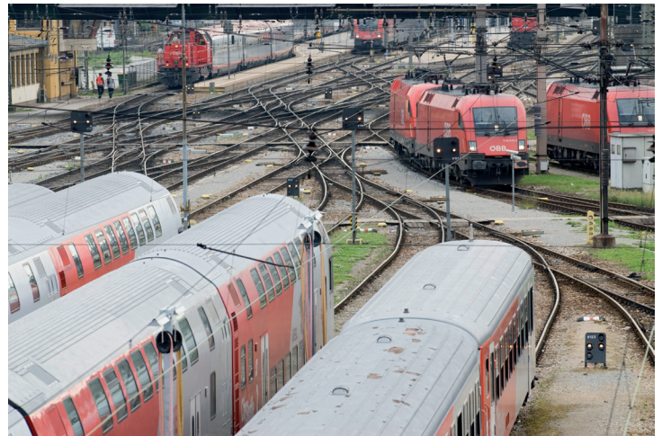
Bildagentur Waldhäus / Alchinger Thomas

Umweltbelastende Steuervergünstigungen sind sozial ungerecht! Die Industrie als größter CO2 Verursacher ist fein raus: sie kann sich günstig freikaufen. Menschen mit geringem Einkommen können das nicht! Gleichzeitig handeln sie weniger umweltschädlich, weil sie es sich einfach nicht leisten können. Sie machen von vielen unökologischen Steuerzuckerln keinen Gebrauch. 50% der Neuzulassungen sind Firmenwagen, deren Anschaffung bis zu 30% subventioniert wird. 60% der einkommensschwachen Haushalte haben hingegen gar kein Auto. Die Spätfolgen der Umweltbelastungen tragen sie aber überproportional stark: sie leben in verkehrsbelasteten Randzonen, werden durch teurere Lebensmittel belastet, Unwetterschäden sind für sie schnell eine Existenzbedrohung. Daher: sozial gerechte Ökosteuern statt Steuervergünstigung für Umweltsünder.