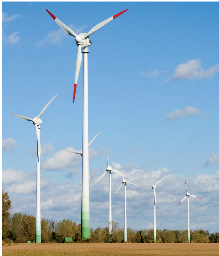
Errichtung eines Windparks im Marchfeld

Diese Initiativen werden aber kaum gefördert, noch immer heizt eine Million Haushalte in Österreich mit Erdöl. Investitionen von jährlich rund 340 Millionen Euro in entsprechende Förderungen und thermische Sanierung würden nicht nur das Klima schonen, sondern auch die Stromkosten für die Haushalte senken. Zusätzlich könnten so bis zu 2000 neue Arbeitsplätze geschaffen werden. Und vielleicht das wichtigste: mit jeder Umdrehung der Windräder fließt Geld in die lokale Wirtschaft, statt in die Kassen der Energiemultis!