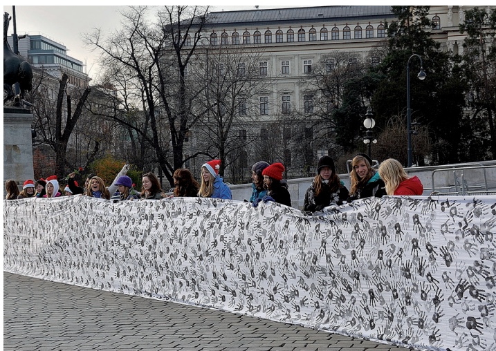
Aktion 20.000 Hände gegen die Kürzung der Familienbeihilfe

Es herrscht Notstand in der österreichischen Bildungspolitik. Schulen und Unis sind unterfinanziert. Mehr Geld für Bildung würde sich mehrfach lohnen. Investiert man nur zwei Prozent der gesamten Wirtschaftsleistung in die Unis, würden 14.000 Arbeitsplätze geschaffen und vielen jungen Menschen ein Hochschulabschluss ermöglicht. Mehr und bessere Bildung braucht aber auch gute Rahmenbedingungen für Studierende. Die Kürzung